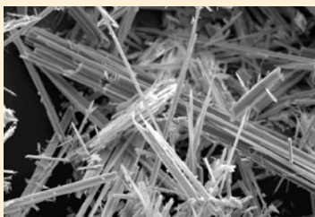
Fibras de Amianto