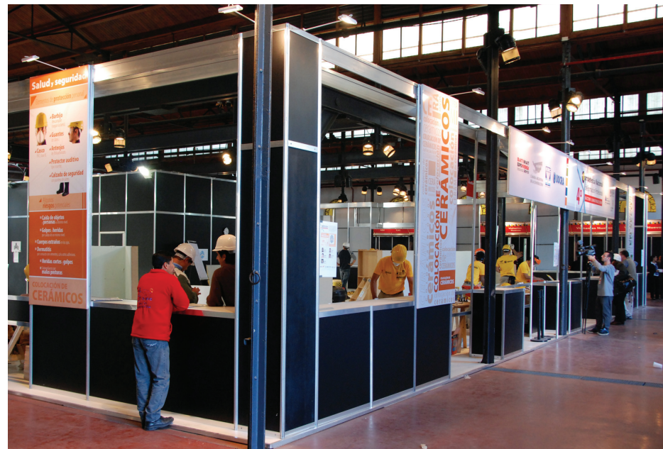
Alumnos de la Fundación UOCRA en pleno desarrollo de la Competencia Nacional de Formación Profesional.

Esta competencia nacional de formación profesional fue creada en 2010 por la fundación UOCRA, con el objetivo de desarrollar, a nivel lo-