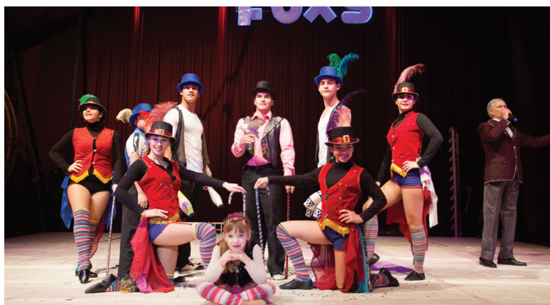
Diversión, sorpresas y regalos para nuestros niños en su día.