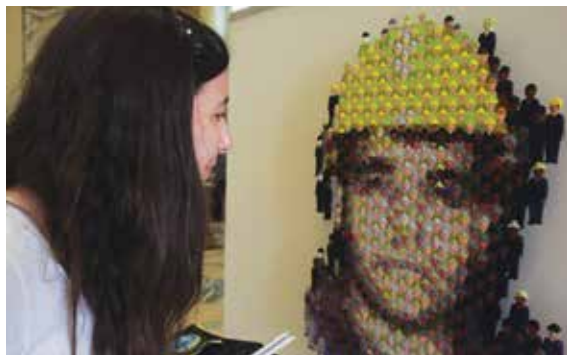
Las obras abordan los valores del trabajador constructor y su familia.

ConstruyendoArte2016 consistió en la realización de una muestra de arte plástico denominada "Puentes, Lazos de Solidaridad, Unión y Fuerza-Valores del Trabajador Constructor en el Mundo del Trabajo". Esta propuesta pretende abordar la idea del arte como herramienta para promover el desarrollo cultural, educativo y social de las y los trabajadores, poniendo énfasis en el valor y la importancia del trabajo y cuenta con la participación de obras realizadas por artistas plásticos consagrados y nuevos artistas contemporáneos del ámbito local.