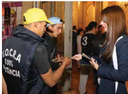
Los trabajadores constructores dijeron presente y participaron del evento.

E n el Salón Dorado de la Legislatura de la Ciudad de Buenos Aires se presentó la segunda edición del programa Construyendo Arte, iniciativa de la Red Social UOCRA, concebida como una herramienta de promoción del arte y la cultura nacional y como un puente de intercambio entre los trabajadores, la cultura del trabajo y el ámbito creativo artístico y cultural.