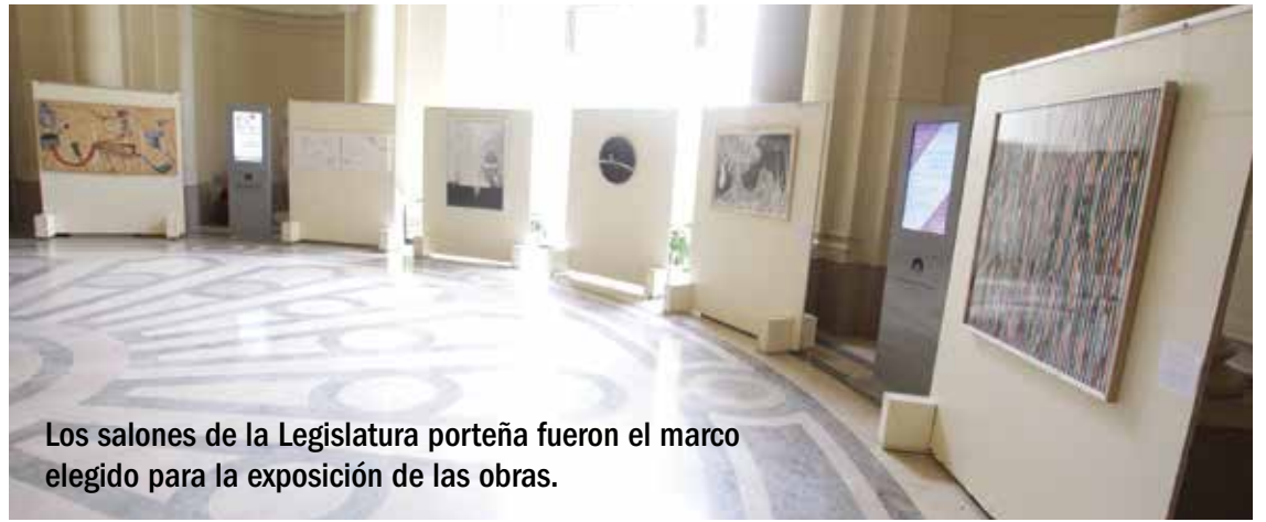
Los salones de la Legislatura porteña fueron el marco elegido para la exposición de las obras.